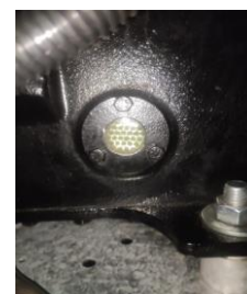
SE CAMBIARON FILTROS DE LIQUIDO Y DE SUCCION