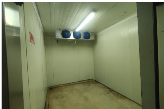
CUARTO DE VISCERAS ROJAS