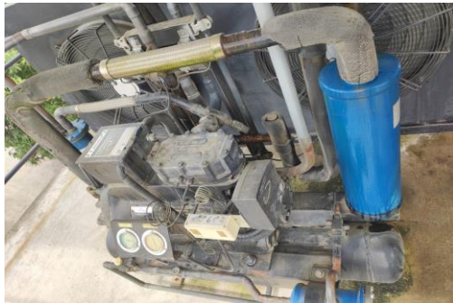
EJEMPLO DESPUES DE MANTENIMIENTO