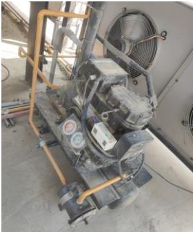
EJEMPLO ANTES DE MANTENIMIENTO