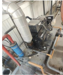
EJEMPLO DESPUES DE MANTENIMIENTO